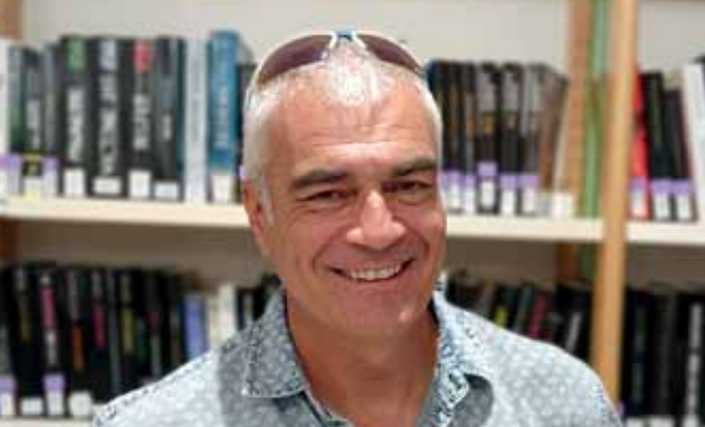
Jean-Marc de LUSTRAC Maire de La Boixe